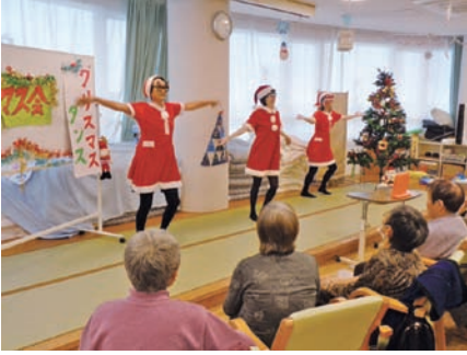
職員が仮装し、ダンスやマジックなどを披露しました。