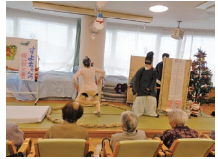
仮装大賞で相撲を披露。 はっけよい、のこった。