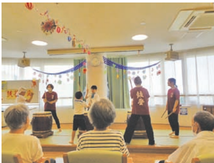
太鼓の音が体に響きました。