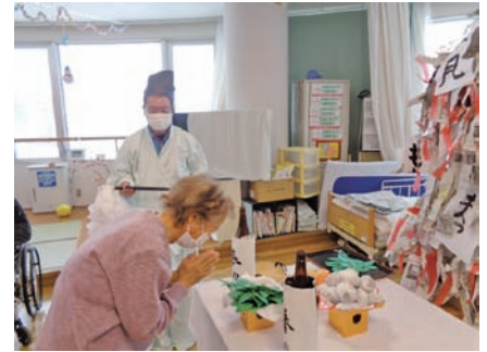
どんど焼きの雰囲気を感じていただきました。