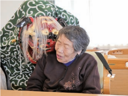
獅子に噛んでもらい疫病退散。無病息災を祈りました。