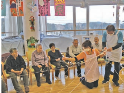
宝引きで今年最初の運試し。