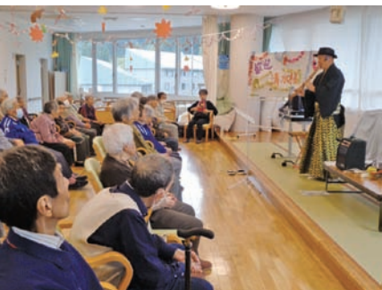
尺八を披露していただきました。