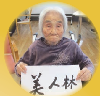
題字：特養ご利用者