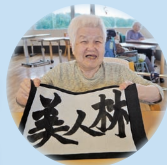
題字：特養ご利用者