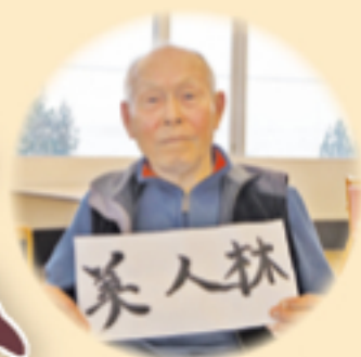
題字：特養ご利用者