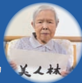
題字：特養ご利用者